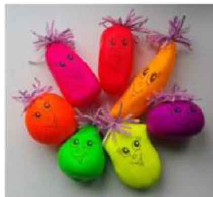
Рисунок на шарике

И еще одна идея для детей постарше, которую вы также можете реализовать самостоятельно, пока ваш кроха побудет наблюдателем. Перед тем как надуть шарик, нарисуйте на нем какой-нибудь рисунок. Это удобно делать гелевой ручкой или перманентным маркером. Теперь надуйте шарик, чтобы ребенок увидел, как «растет» картинка. Очень эффектно будет выглядеть, если, например, маленький медвежонок на глазах малыша превратится в большущего медведя