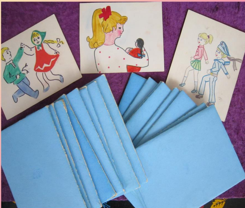
Дидактическая игра «Жанры музыки»