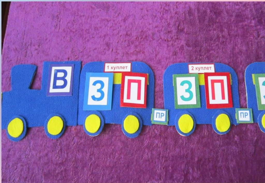
Пособие «Паровозик - песенка»