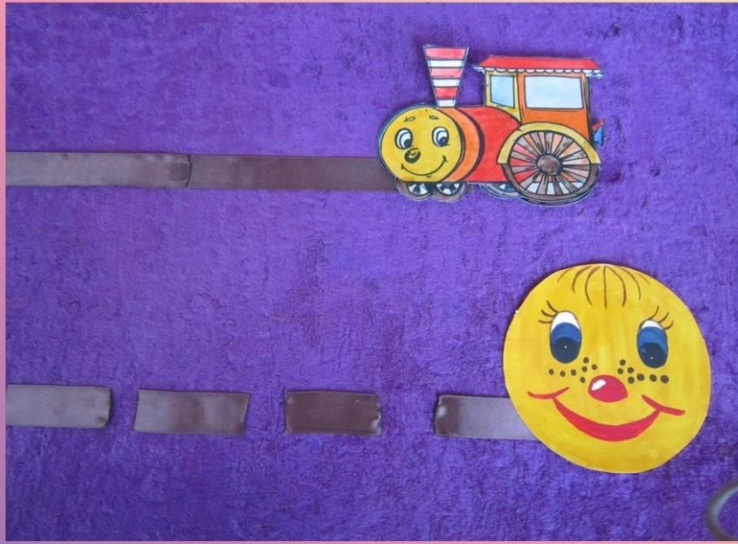
Игра «Длинная и короткая дорожки»