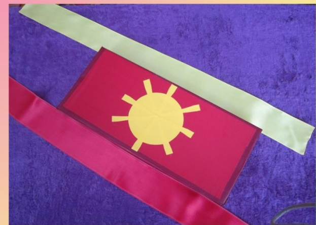
Пособие «Солнечные лучики»