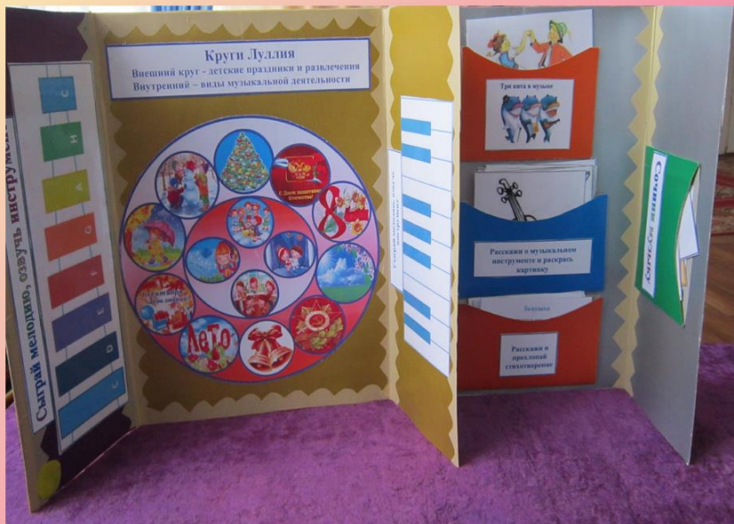
Лепбук «Музыкальная книжка»