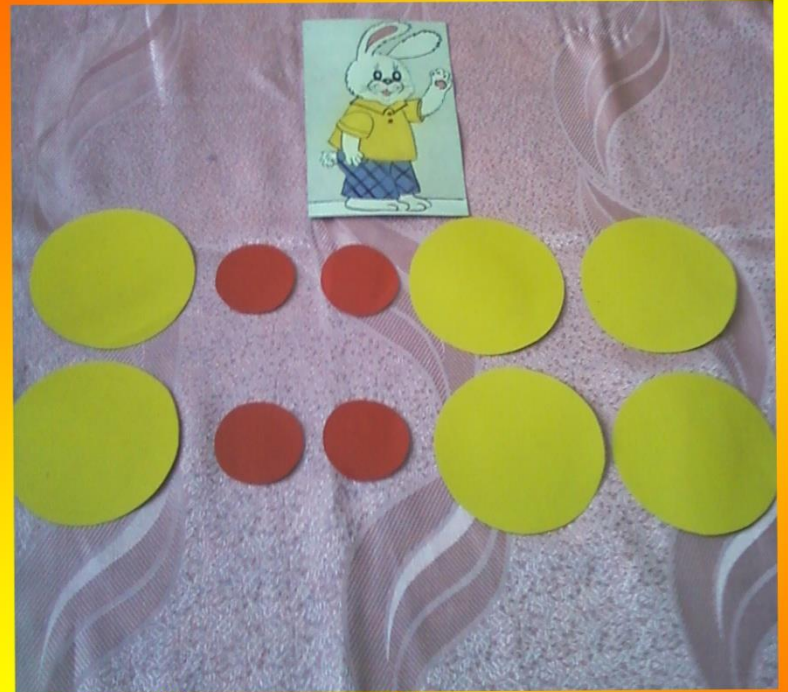
Условное обозначение долгих и коротких звуков