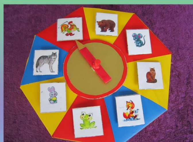
Пособие «Веселая карусель» «Кто сидит на карусели» - развитие пантомимических навыков»