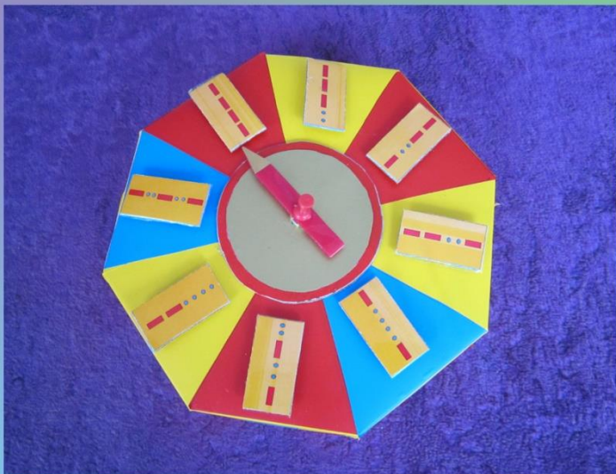
Пособие «Веселая карусель» Простучи ритм