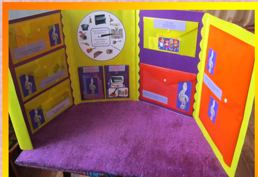
Лепбук «Музыкальные инструменты»