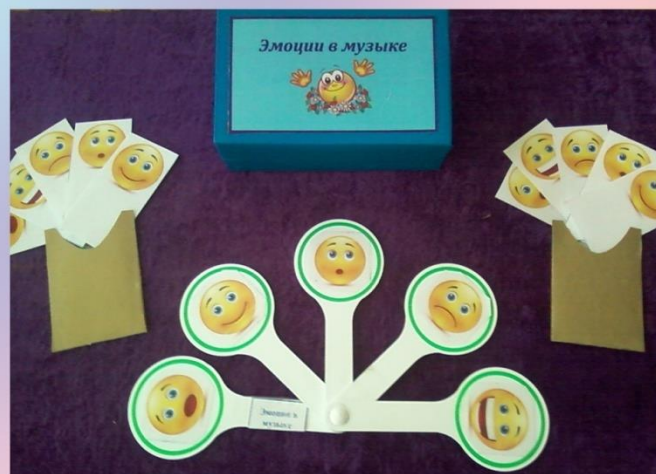
Пособие «Эмоции в музыке»