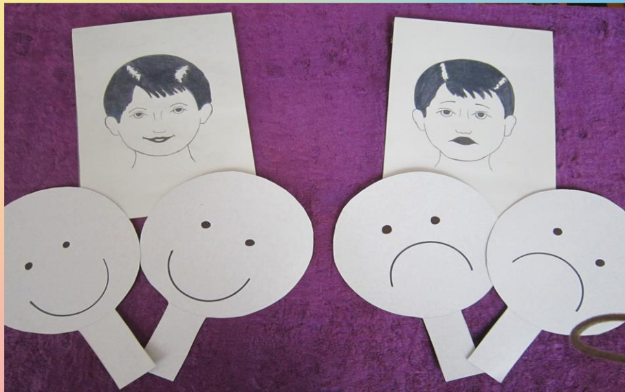
Настроение в музыке - пиктограммы (карточки для всей группы)