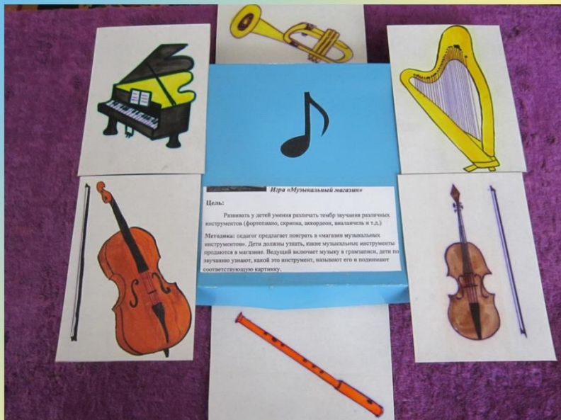
Дидактическая игра «Музыкальный магазин»